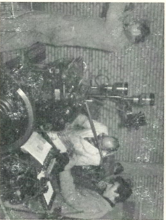
De Heideberger kan weer draaien!

Dat zeiden wij niet alleen, maar daar waren wij vast van overtuigd. De heer Biquet, de baas van de Drukkerij, en zijn mannen dachten er echter heel anders over en wij moeten eerlijk toegeven dat zij gelijk hebben gekregen. Wij begrijpen nog niet goed hoe het mogelijk is, dat je vrijdagmiddag om 15.00 uur begint met het VDH-tje te drukken in een half ingerichte ruimte aan de Saturnustraat, terwijl je s morgens om 11.00 uur met je hele hebben en houwen nog in de fabriek aan de Laakweg zit.