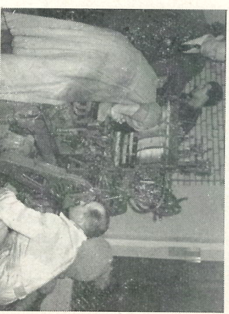
Hoe dan ook, over een half uur moeten we draaien.

redactie kon gerust zijn: het VDH-tje was s'zaterdagds op dezelfde tijd klaar als anders en daarvoor zeggan wij allen die hiernaan hebben meegewerkt hartelijk dank!